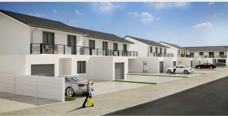
Bauteil 1: Reihenhauser 1 – 3 Fertigstellung Sommer 2016