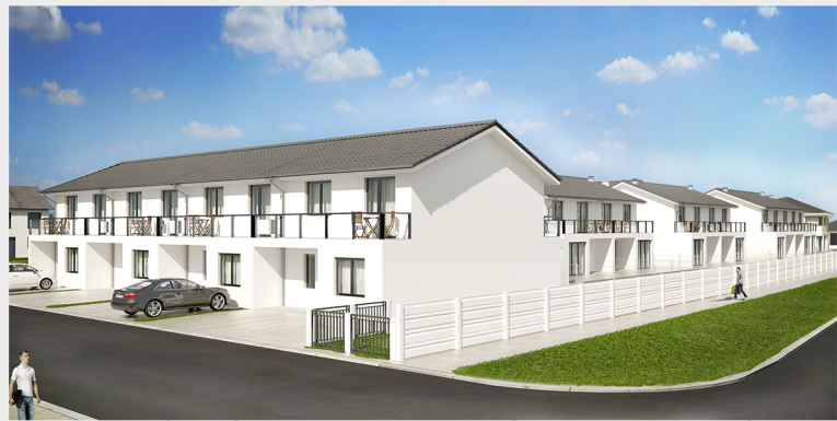
Bauteil 2: Reihenhauser 4 – 11 Fertigstellung 4. Frühling 2017